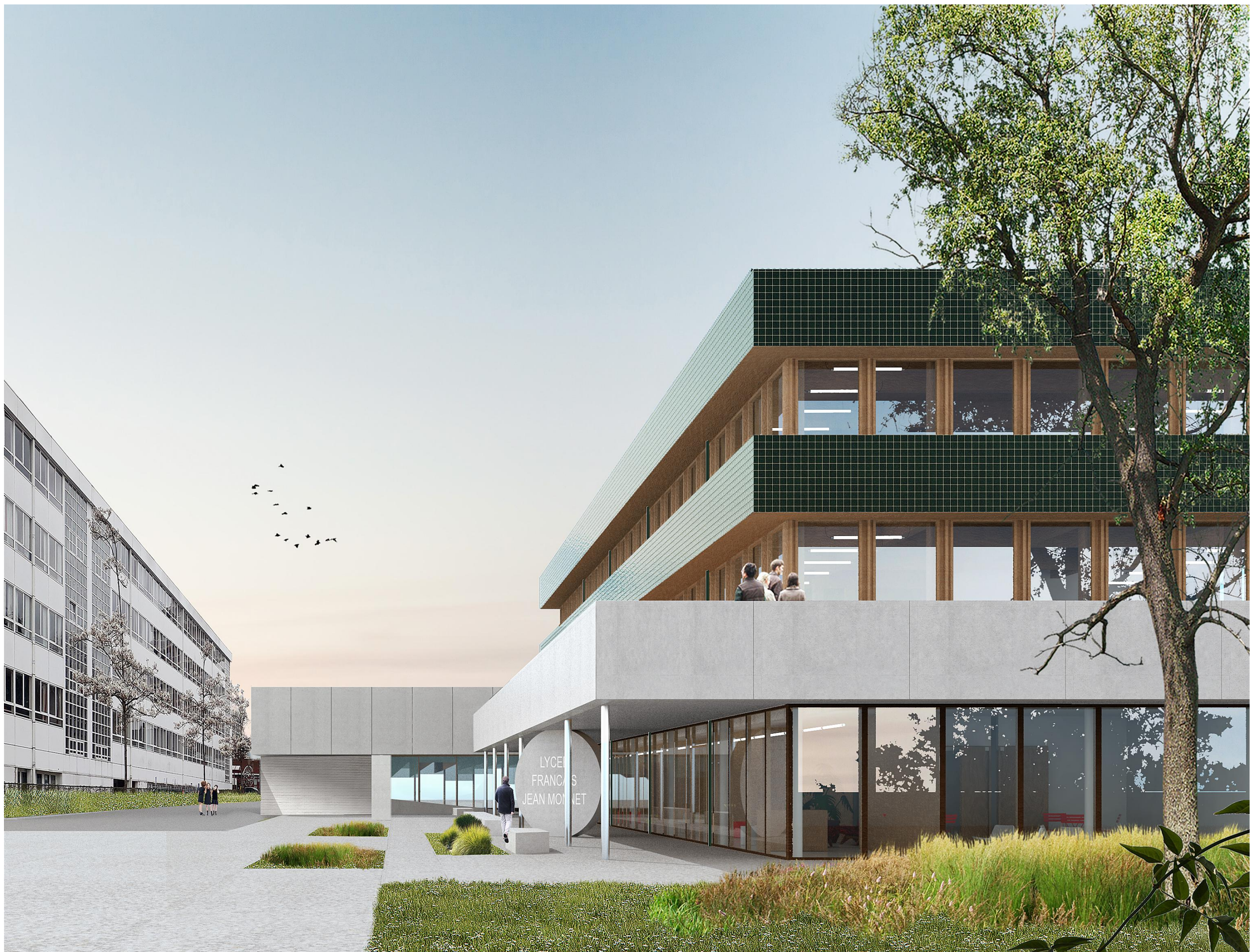
Perspective 1 _ Situation projetée _ Vue depuis la rue du lycée français