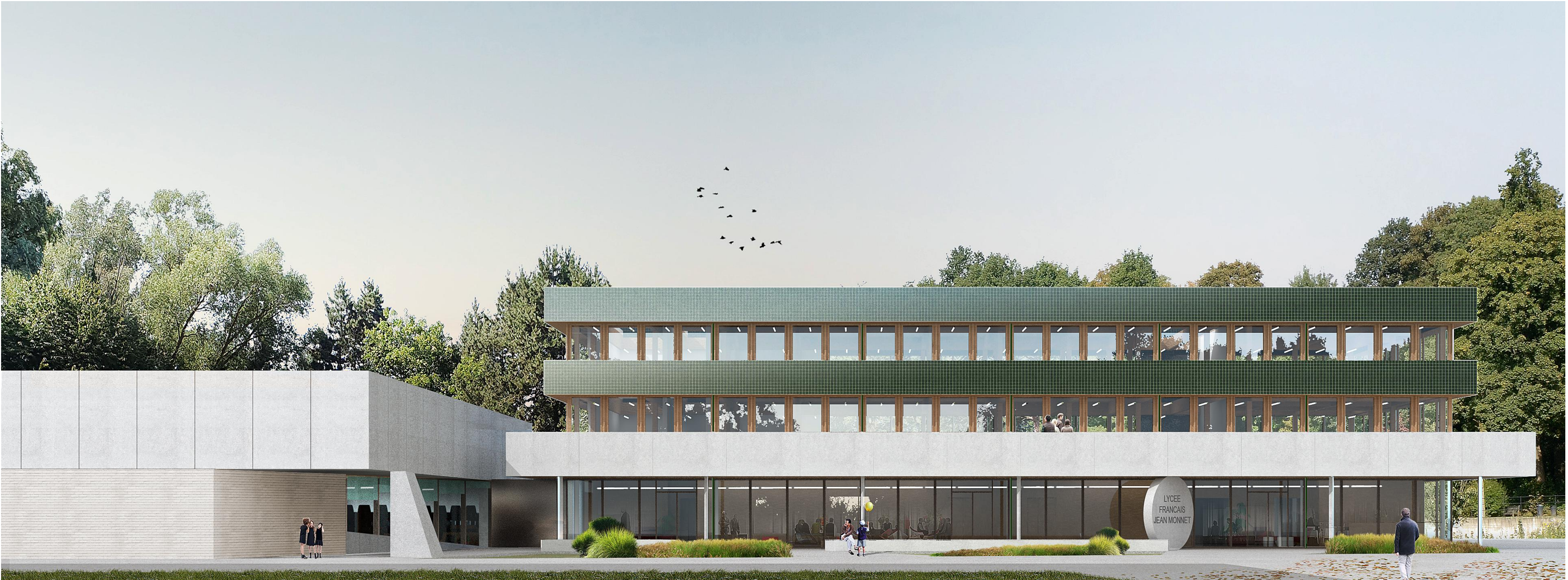
Perspective 2 _ Situation projetée _ Vue depuis le parvis intérieur